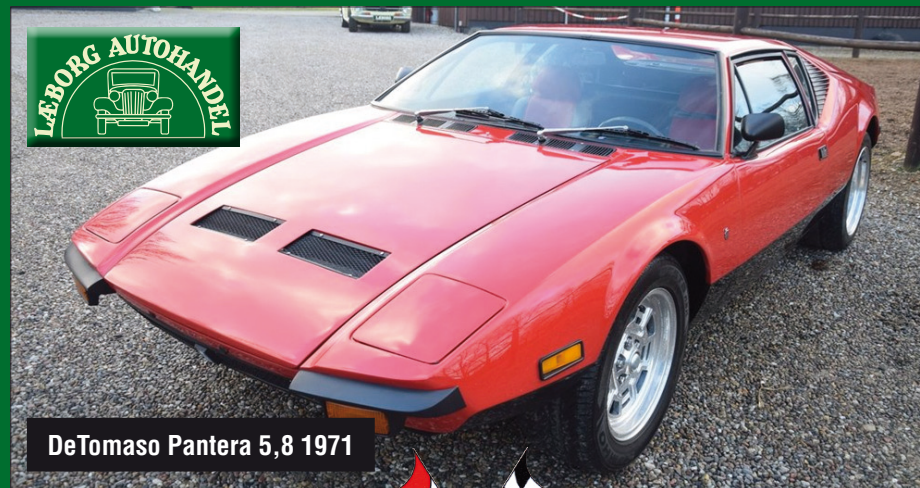
DeTomaso Pantera 5,8 1971

- auf Wiedersehen... Dansk Historisk Motor Club