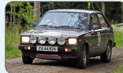
Vinder af Classic Car Challenge 2012 og 2013: Poul og Egon Brøndum, Toyota Starlet